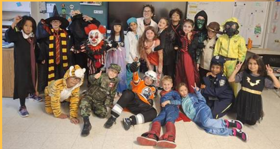
Photo de groupe 3e année