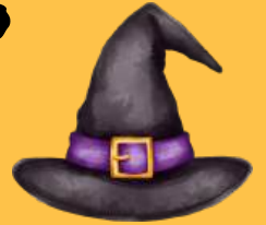
PHOTO AMUSANTE DU PERSONNEL 2025-2026