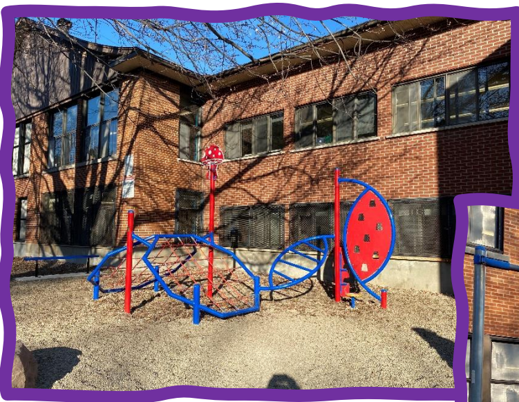
Aménagement de la cour d'école