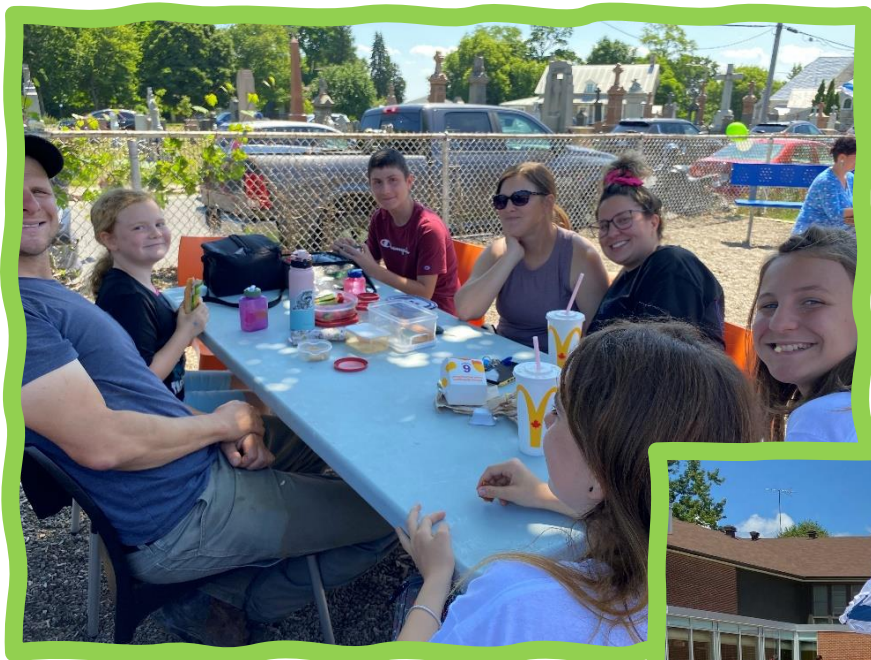
Pique-nique familial de fin d'année