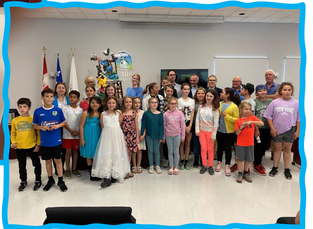
Chaise des générations