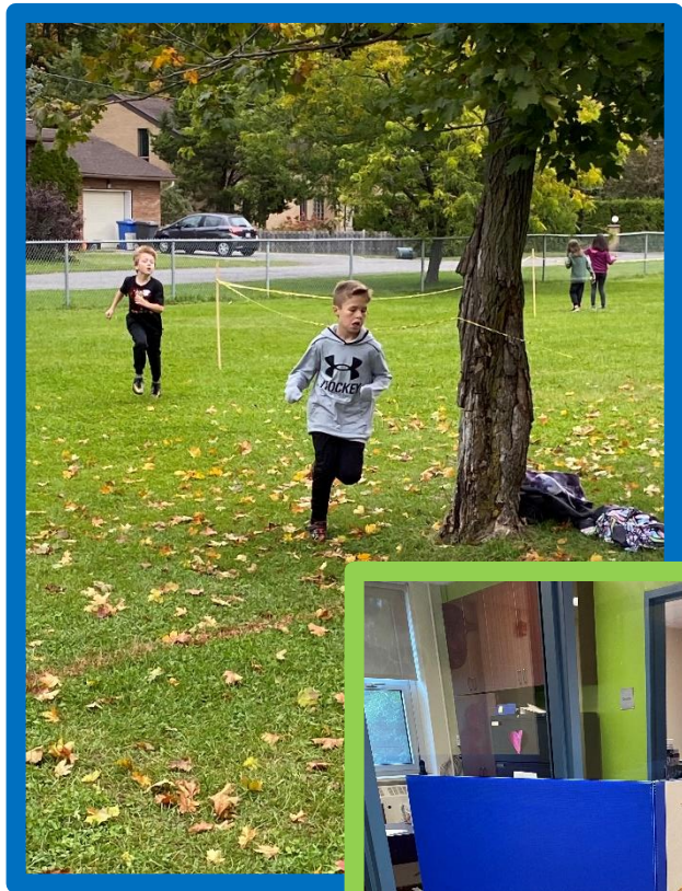
Course de Cross-Country