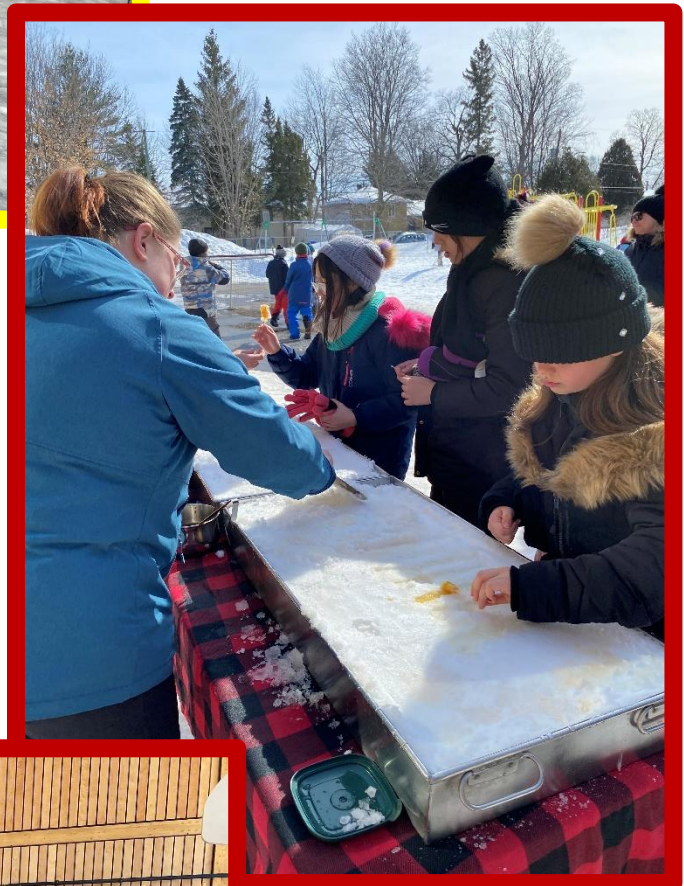
Cabane à sucre